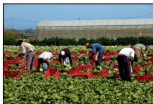
Cosechando: Frutas, vegetales, etc.