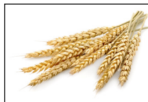
Cultivos: Trigo, maíz, frijoles, etc.