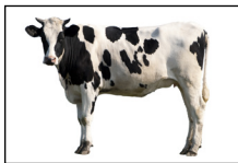
Ganadería: Ovejas, cerdos, lechería, etc.

¿Alguien en su familia ha trabajado en algo relacionado con los trabajos listados abajo? Si No