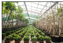
Semillero: Césped, invernadero, etc.