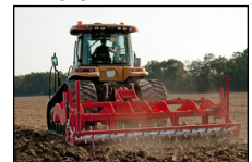
Preparación del Suelo