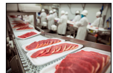
Procesando: Carne, frutas, arboles, verduras, etc.